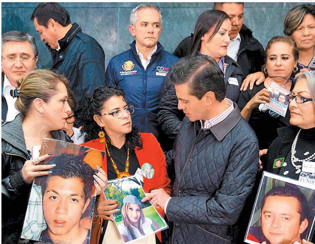
El Presidente recibió en Los Pinos a familiares y representantes de organizaciones y colectivos.

Entregan al autor nicaragüense el mayor premio de las letras en lengua española P. 58