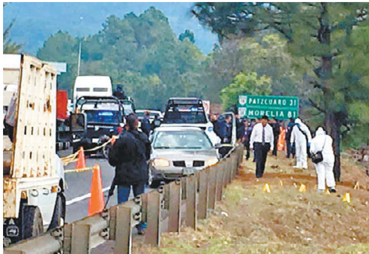
Mando de Ziracuaretiro fue ultimado en la autopista Siglo XXI.

Detienen a 5 cómplices y liberan a dos víctimas de secuestro P. 20