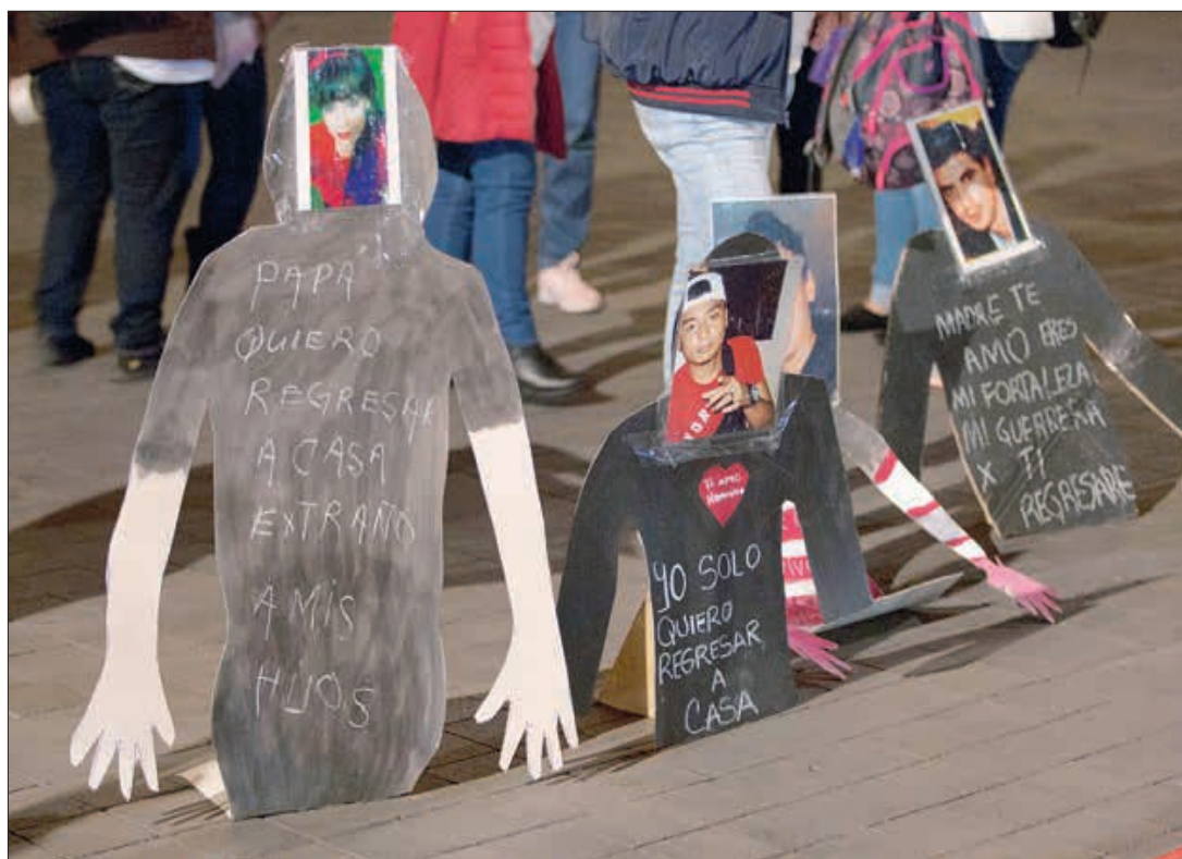
▲ Los manifestantes colocaron mantas con las fotografías de sus seres queridos, así como siluetas de cartón, frente a Palacio Nacional para denunciar la falta de avance en sus casos. Denunciaron que

tuvieron que suspender búsquedas en Jalisco, luego de que las autoridades estatales no les garantizaron un equipo de seguridad para protegerlos. FERNANDO CAMACHO / P 10