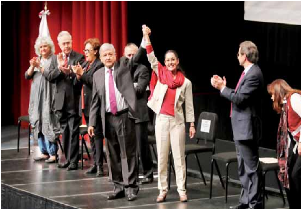
Andrés Manuel López Obrador, dirigente nacional del partido Movimiento Regeneración Nacional (Morena), encabezó ayer en el Auditorio Nacional la presentación del Proyecto Alternativo de Nación 2018-2024. En el acto dio su respaldo a Claudia Sheinbaum, delegada en Tlalpan y coordinadora de organización territorial de ese organismo político

■ El tabasqueño llama a “reforzar la unidad ante la guerra sucia”; en diciembre presentará posible gabinete