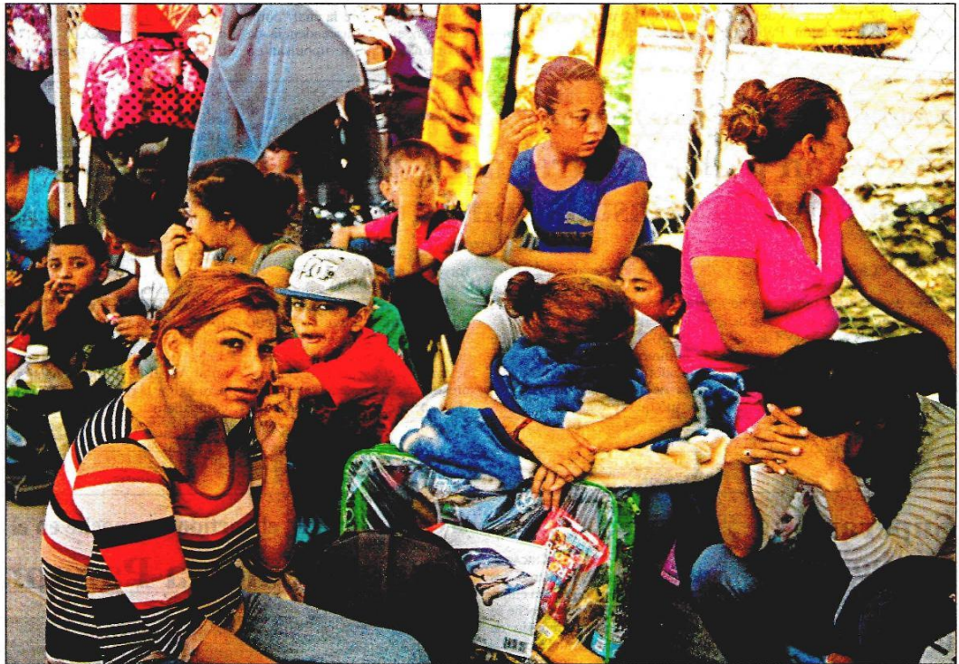
Familias completas se han refugiado en Tijuana, Baja California, por el desplazamiento forzado ante la oleada de violencia en sus lugares de origen. En las garitas de Calexico y San Ysidro, California, realizan las peticiones de asilo, pero la mayoría de casos ni siquiera se revisan