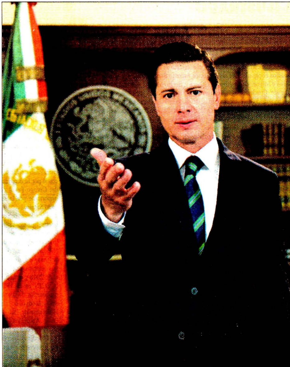
El presidente Enrique Peña Nieto, en mensaje a la nación, fijó su postura ante las acciones de Donald Trump de enviar a la Guardia Nacional a la frontera común

■ AMLO: el interés del país está primero; Meade: unidos somos más fuertes; Anaya: todavía falta más firmeza