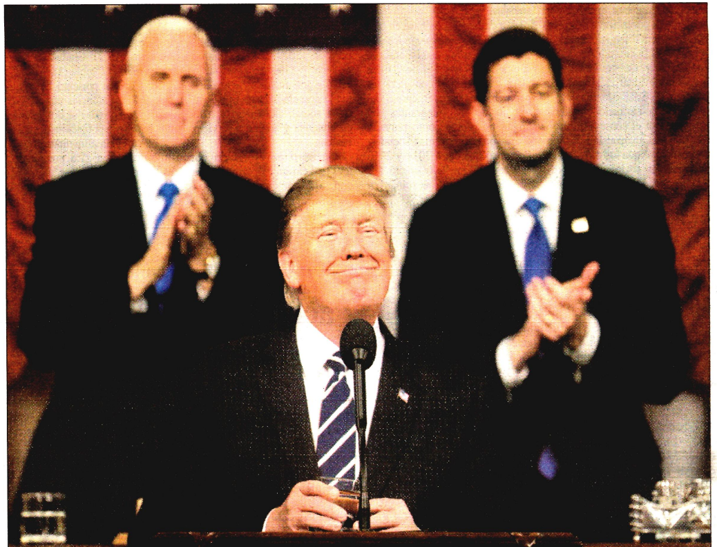
En un discurso lleno de retórica ante el Congreso estadounidense, el presidente Donald Trump festejó sus primeros "logros" al frente de la Casa Blanca. Dijo que son "el inicio de un nuevo capítulo de la grandeza de Estados Unidos, donde la antorcha de la verdad, libertad y justicia será usada para alumbrar al mundo"

■ Autoridades estadounidenses les imputaron algún delito