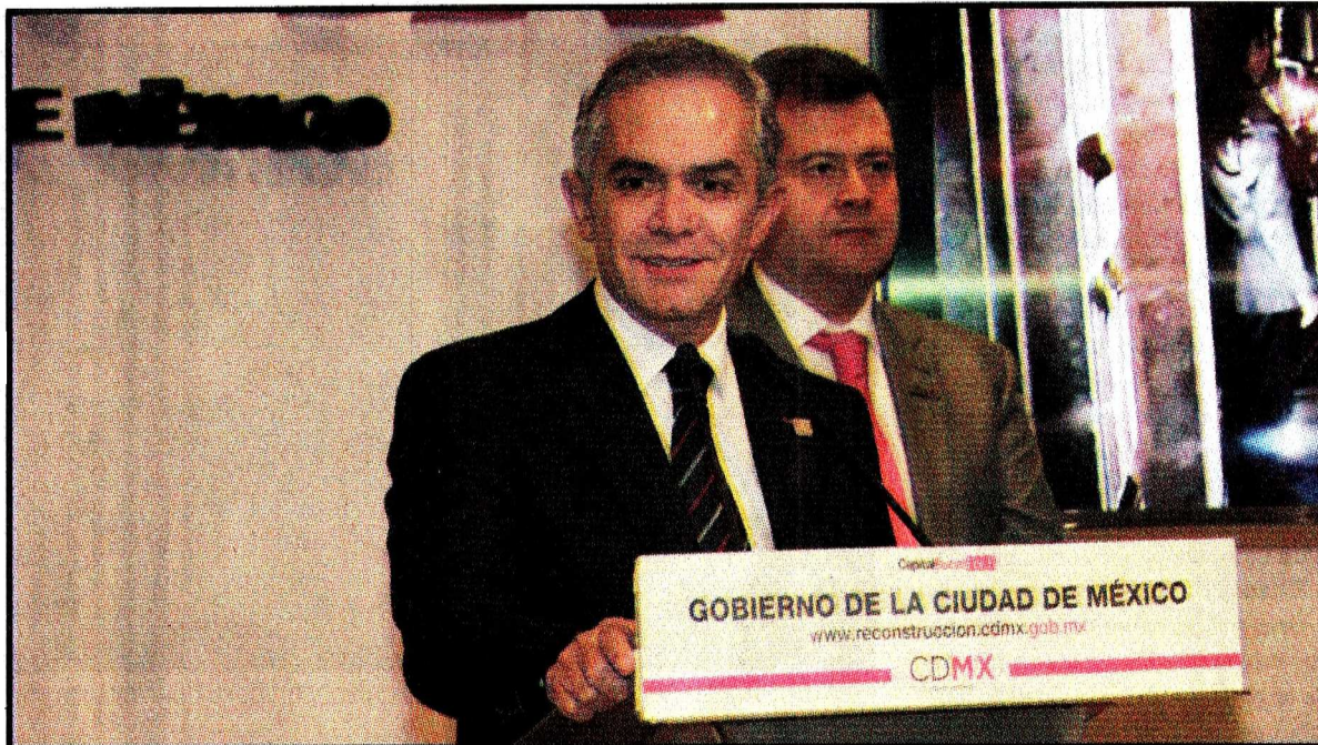
Miguel Angel Mancera. Avances en la reconstrucción.

Con respecto a los nuevos taxis híbridos, enfatizó que el compromiso con el secretario de Movilidad (SEMOVI) es que cada mes en promedio entren en circulación 50 vehículos para sustituir viejas unidades y que no se pierda el ritmo de avance.