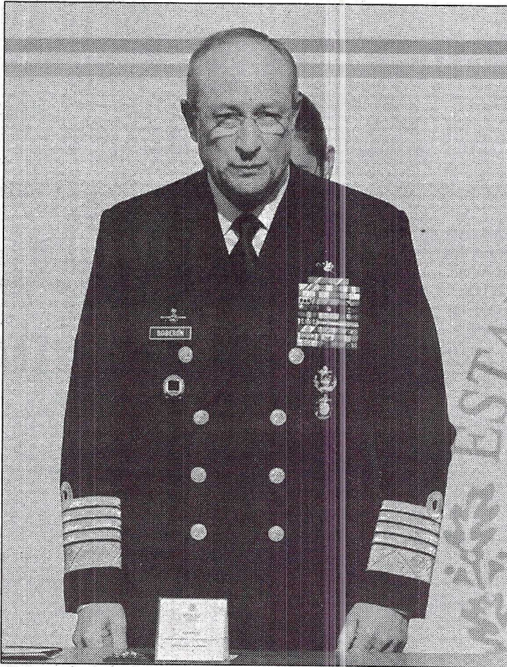
Las fuerzas armadas trabajan de cerca con los gobernadores y los presidentes municipales con la finalidad de que haya buen ambiente electoral y se invite a la gente a ir a votar, señaló el almirante Vidal Francisco Soberón Sanz, titular de la Secretaría de Marina

“Actualmente, de alguna forma se ha contenido la violencia en el estado, pero eso no quiere decir que se ha solventado el problema”, apuntó.