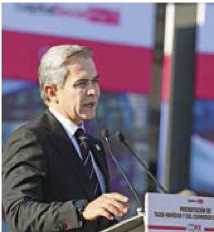
ANTIGUA ASPIRACIÓN. Miguel Mancera buscaba ser candidato a la Presidencia.