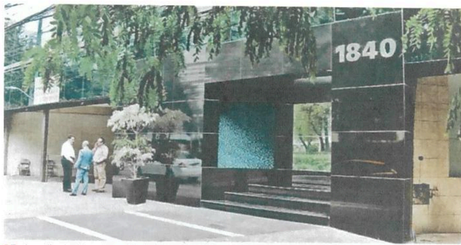
En la calle de Horacio, en Polanco, trabajaban colaboradores de Zebadúa ligados a la estafa.