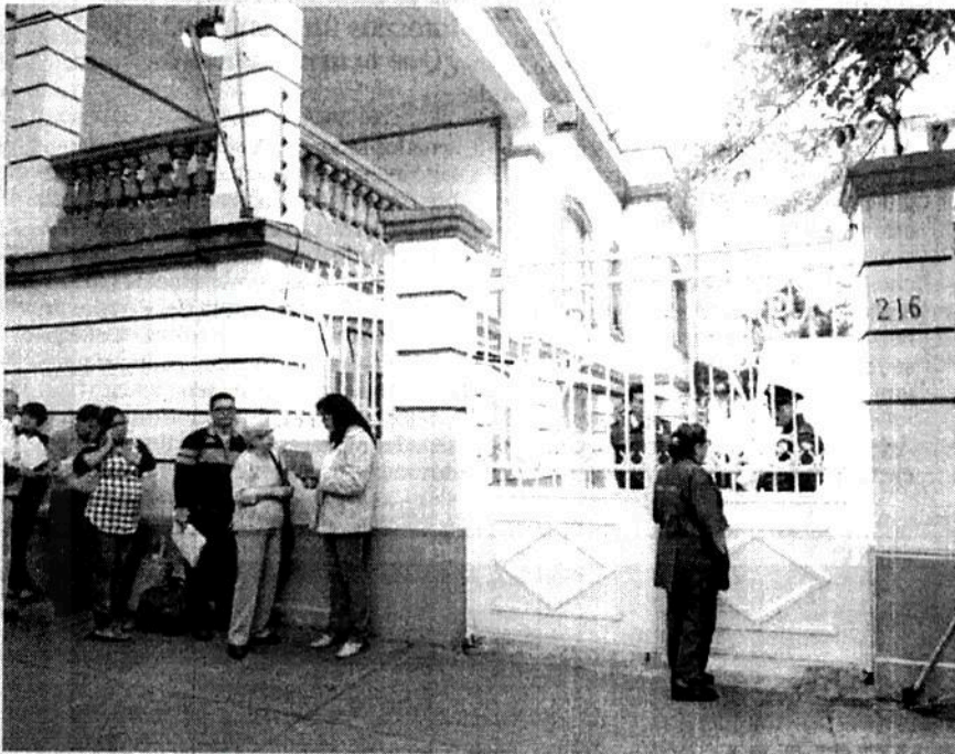
El actual inmueble que ocupa la dirigencia nacional de Morena está ubicado en la calle de Chihuahua 216, en la Roma, misma que fue la casa de transición del Presidente.

El inmueble mencionado es un laberinto de aulas semidesocupadas, con escaso mobiliario y sólo despachan ahí algunos dirigentes. Su uso prácticamente es como domicilio fiscal, para que estén a la vista los estrados y como domicilio para oír y recibir notificaciones. ●