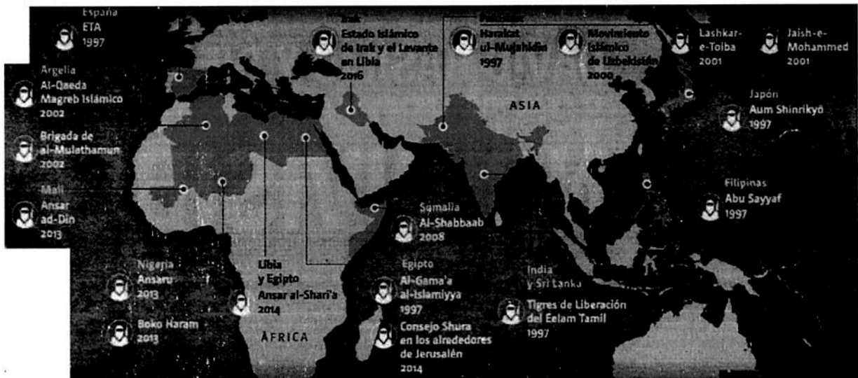
Mapa de grupos terroristas en el mundo. Fuente: Global Terrorism Index 2018. El mapa muestra la ubicación geográfica de los grupos terroristas más activos en el mundo durante el período 2015-2017.