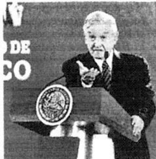
Ensalzó al peso. J. CARBALLO

El Presidente señaló que en su reunión del miércoles con empresarios hizo un "reclamo fraterno" por el caso TransCanada.