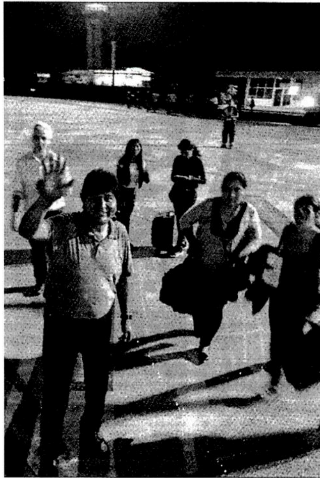
▲ Evo Morales antes de abordar en Bolivia el avión que lo trasladaría a México.