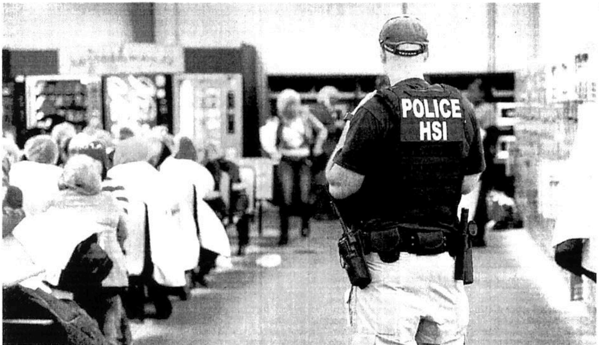
Un elemento de la agencia migratoria estadounidense, durante una revisión realizada a una empresa en Canton, Mississippi.