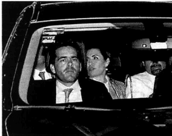
Robles estuvo en la audiencia casi 12 horas.

La FGR dejó ir a la ex funcionaria del Centro de Justicia Penal Federal del Reclusorio Sur sin solicitar alguna medida cautelar en su contra, hecho que sorprendió al propio juez.