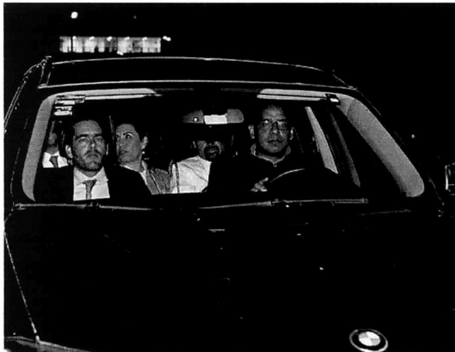
■ Rosario Robles, ex titular de la Sedesol y la Sedatu en el sexenio de Enrique Peña Nieto, a su salida anoche de los juzgados en el Reclusorio Sur.

■ Conforme al artículo 214, fracción tercera, del Código Penal Federal, este ilícito se penaliza con dos a siete años de cárcel y de 30 a 150 días multa.