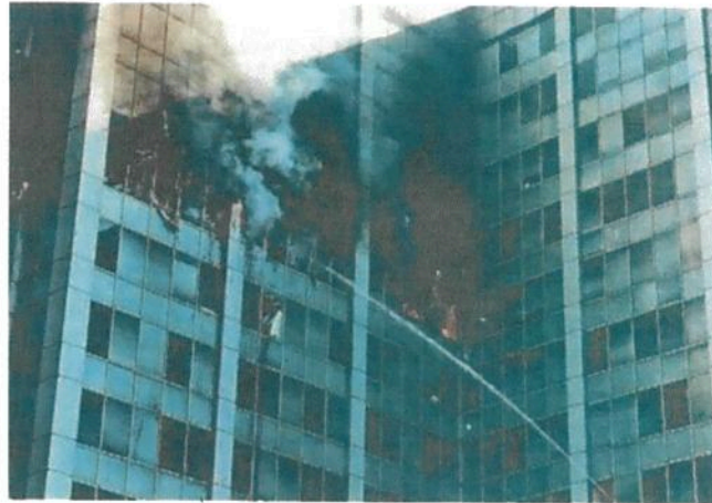
■ Un corto circuito causó el incendio, según el peritaje.

A la par, funcionarios de la Conagua agilizaron los trabajos para concretar la mudanza de un primer equipo técnico de esa dependencia al Puerto de Veracruz, como lo instruyó el Presidente Andrés Manuel López Obrador.