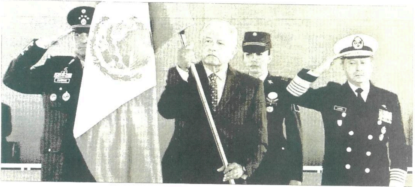
▲ El presidente Andrés Manuel López Obrador encabezó en Coahuila la ceremonia por el 157 aniversario de la Batalla de Puebla.