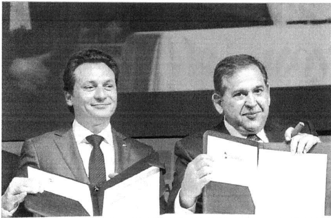
Continúa en siguiente hoja