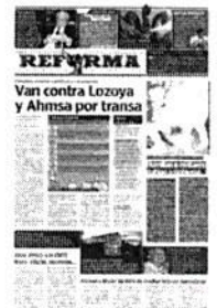
Autodefensas de La Huacana, en Michoacán, sometieron a los militares antes de desarmarlos.