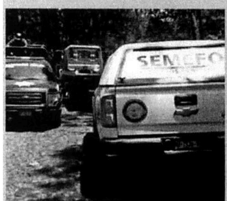
■ El miércoles en Uruapan diez personas resultaron muertas y otras cuatro heridas en un enfrentamiento armado entre criminales rivales.

Además de la retención el pasado domingo de militares por un grupo de habitantes de La Huacana, en la última semana en Michoacán se registraron distintos hechos de violencia.