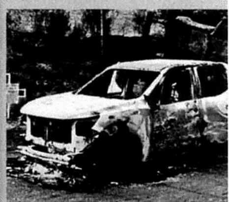
■ El sábado fueron hallados cinco cuerpos calcinados dentro de una camioneta en Uruapan. Las autoridades no confirmaron si el hecho está relacionado con el del miércoles.