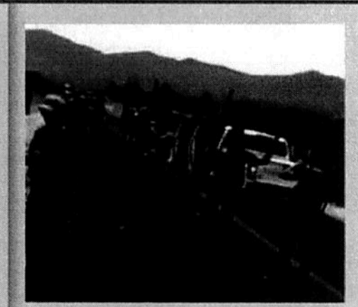
■ Ayer circuló un video en redes donde se observa a sujetos armados amenazando con ir al municipio de Churumuco, localidad cercana a la Huacana.