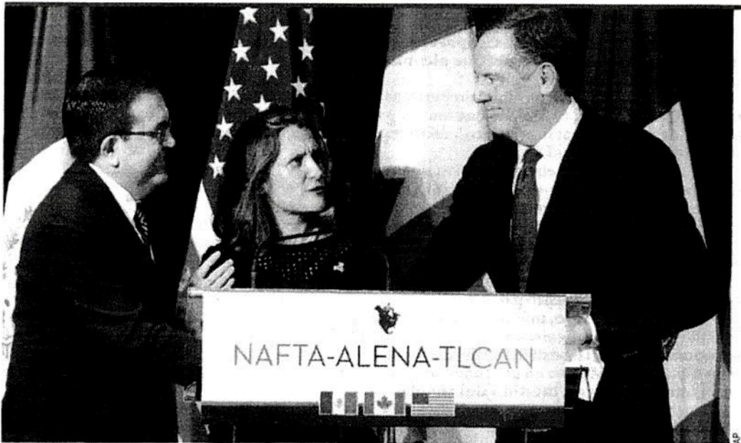
EN CDMX, PRÓXIMA CITA. México, Canadá y EU lograron cerrar ya tres capítulos: Pymes, competencia y anticorrupción.