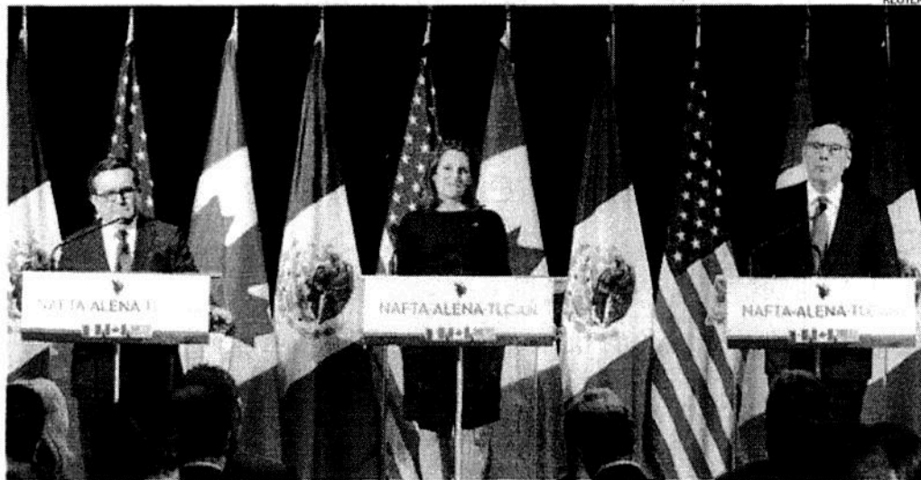
RESULTADOS. En conferencia, los máximos responsables de la negociación por parte de México, Canadá y EU, en Montreal.