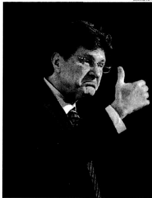
Aclaró que es una reflexión personal basada en el estudio del tema.