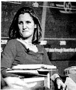
FREELAND. Los problemas de la clase media no son causados por el comercio.