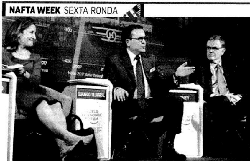
DAVOS. La ministra canadiense de Exteriores, Chrystia Freeland, con el secretario Ildelfonso Guajardo.