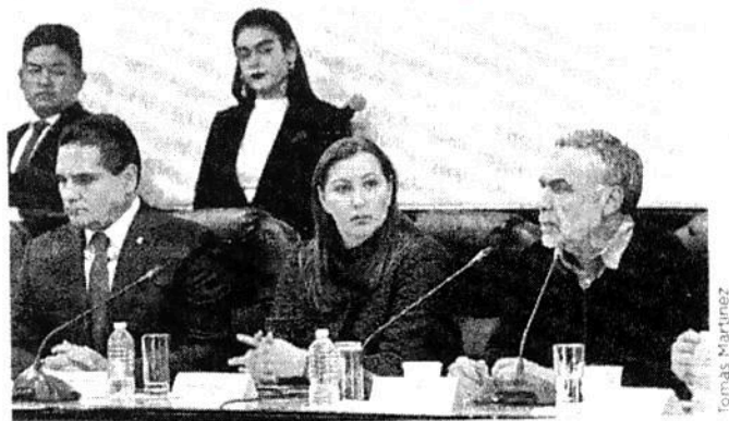
Los mandatarios Silvano Aureoles y Martha Érika Alonso y el diputado Alfonso Ramírez Cuéllar ayer en San Lázaro.

Sin embargo, advirtió que emplazará al legislador de Morena a comprobar las alusiones personales.