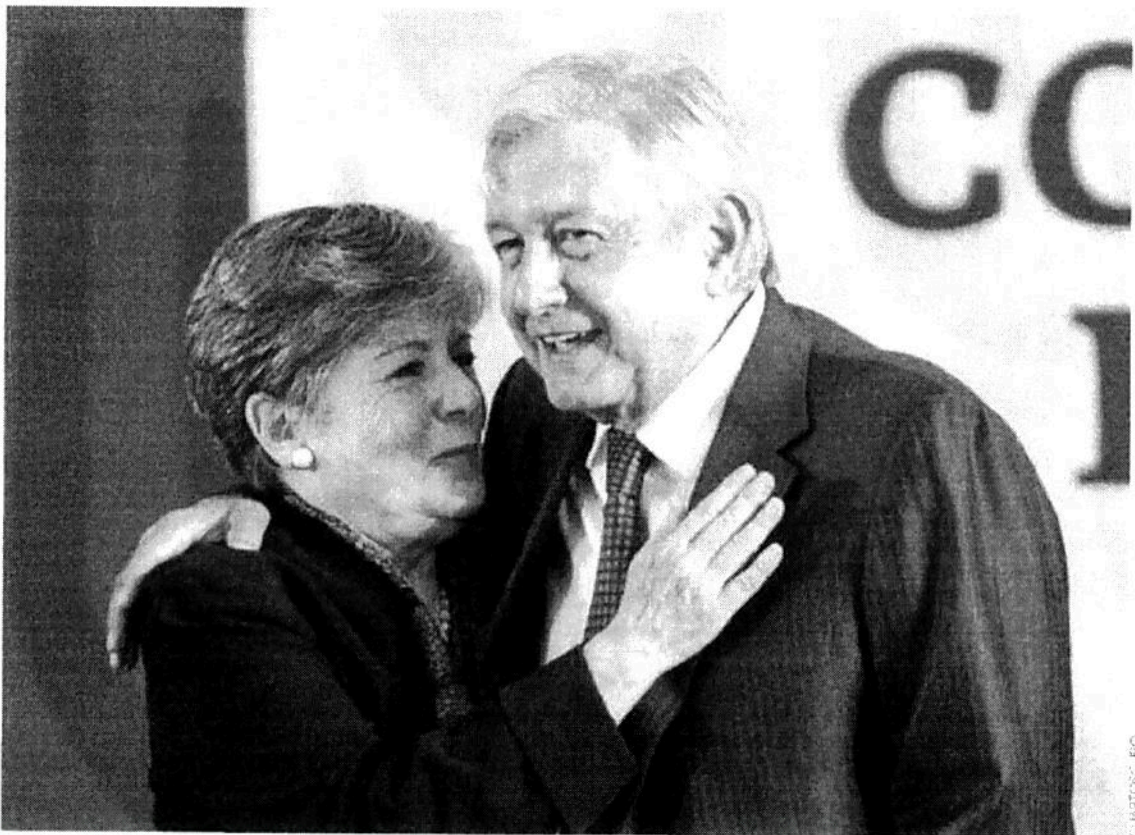
PLAN INTEGRAL Alicia Bárcena, secretaria ejecutiva de la Cooal, y Andrés Manuel López Obrador, ayer, en Palacio Nacional.