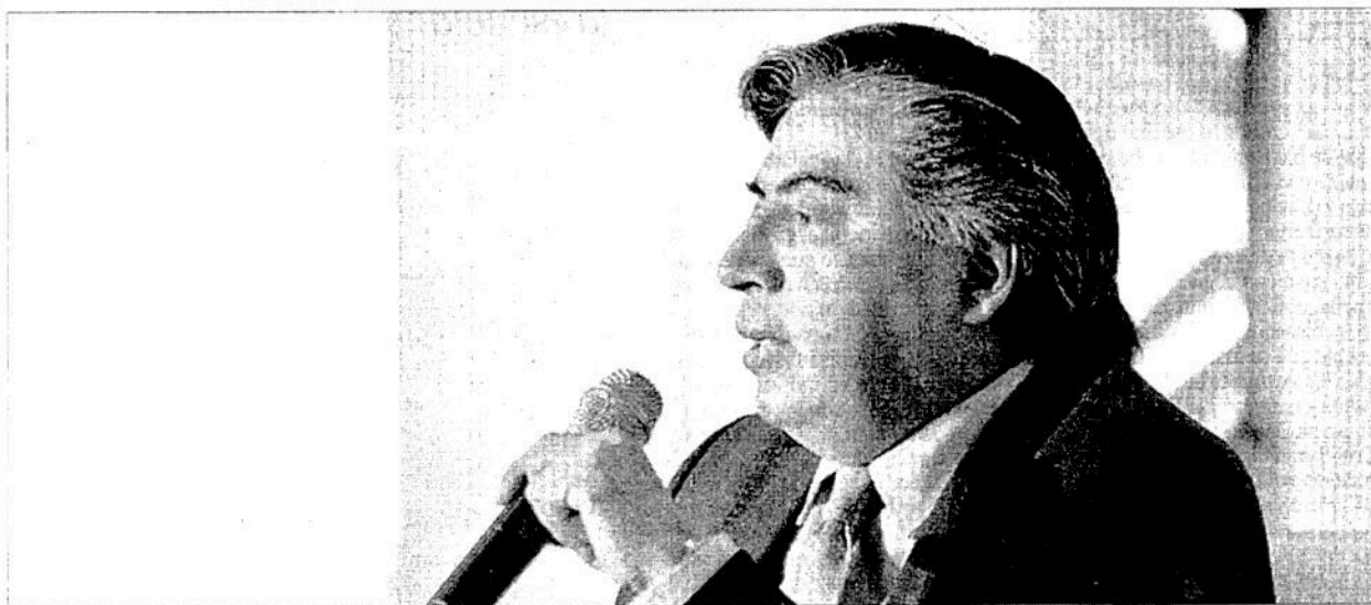
▲ Gerardo Esquivel, próximo subsecretario de Hacienda, indicó que para el Ramo 33, que incluye los servicios de salud de los estados,

"Van a alcanzar los ahorros. Ya se anunció que no habrá endeudamiento, aumento de impuestos ni nuevos aranceles, todo se hará dentro del marco del presupuesto... Se requieren entre 450 mil y 500 mil millones de pesos para los nuevos proyectos prioritarios. Eso saldrá de los ahorros, de la austeridad y con eso se va a financiar", señaló Esquivel al acceder responder sólo tres preguntas de la prensa en menos de minuto y medio.