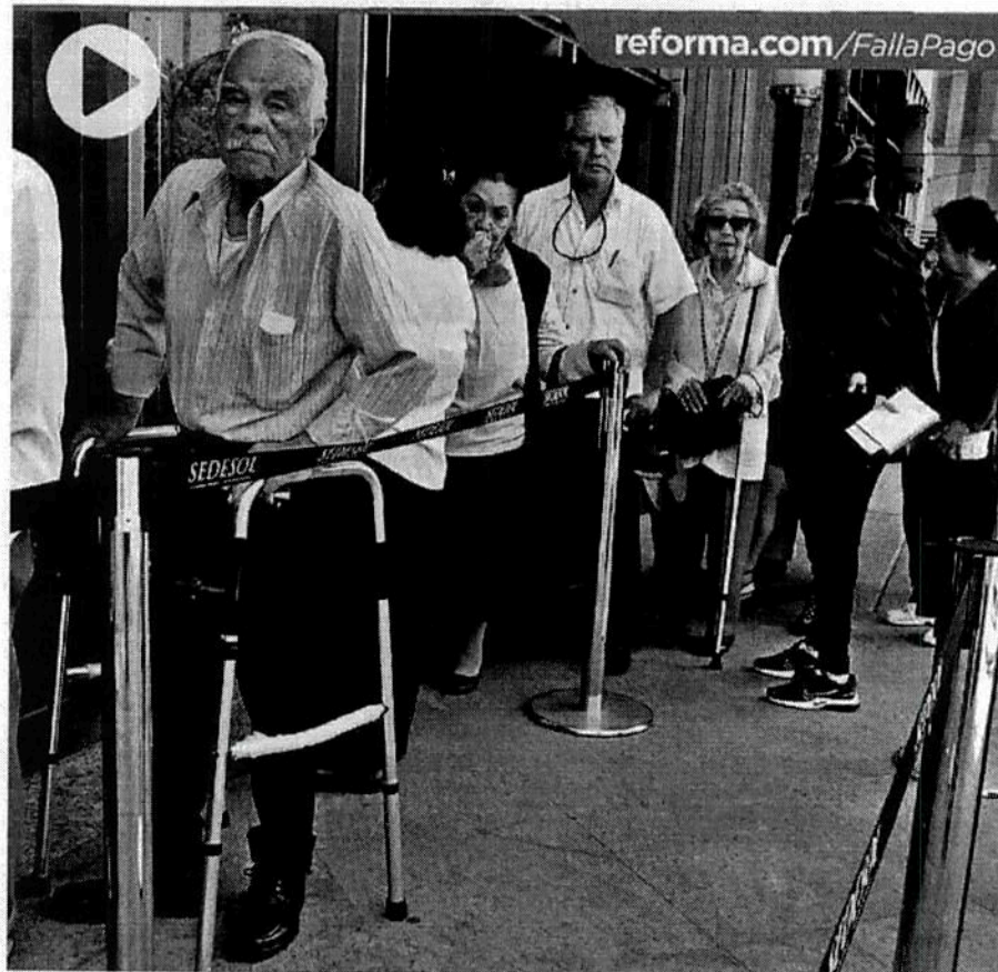
SIN PREFERENCIA. Adultos mayores que acudieron a la oficina de Bienestar a preguntar por su pensión pasaron al menos 20 minutos formados en la calle.

Entre las nuevas incorporaciones están quienes ya recibían pensión de alguna institución de seguridad social. Por ejemplo, del IMSS se han agregado al programa un millón 151 mil 404; del ISSSTE, 276 mil 15; ISSFAM, 8 mil 741; y de Pemex, 30 mil 532.