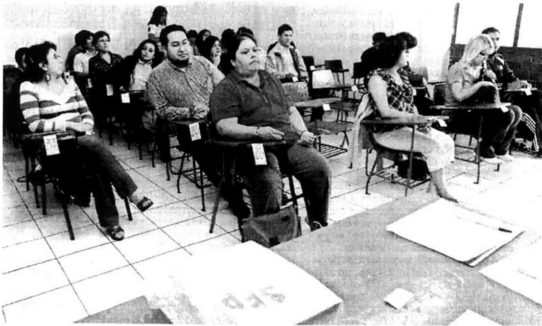
El cambio más importante en la minuta será en el artículo decimosexto transitorio, para garantizar que el Estado mexicano tenga el control total de las plazas del magisterio, a fin de evitar su venta o tráfico.