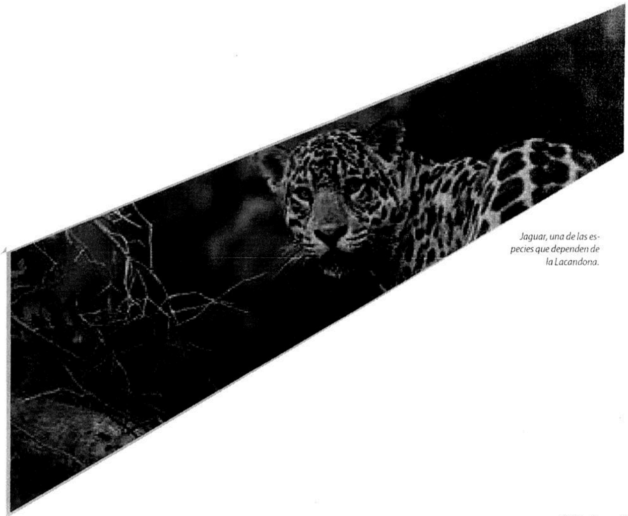
Jaguar, una de las especies que dependen de la Lacandona.