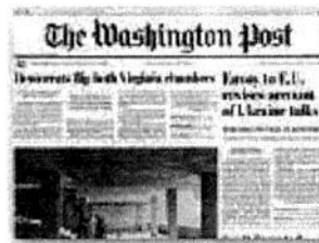
2 El rotativo estadounidense sostiene que el Gobierno mexicano ha sido incapaz de enfrentar al narco.