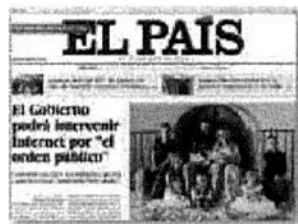
1 En España, El País resalta que la intención de EU por apoyar puede verse más como crítica y amenaza.

La propuesta de Trump para arremeter contra el crimen organizado provocó que la prensa cuestionara el plan de seguridad nacional.