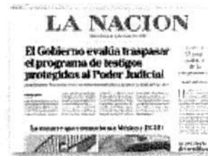
3 El ataque representa un nuevo contrapunto en la relación más estrecha del continente, dice el medio argentino.

PROMOVER SU MURO. El ataque a la familia LeBarón demuestra la importancia de construir el muro entre México y Estados Unidos, sostuvo, por su parte, Donald Trump.