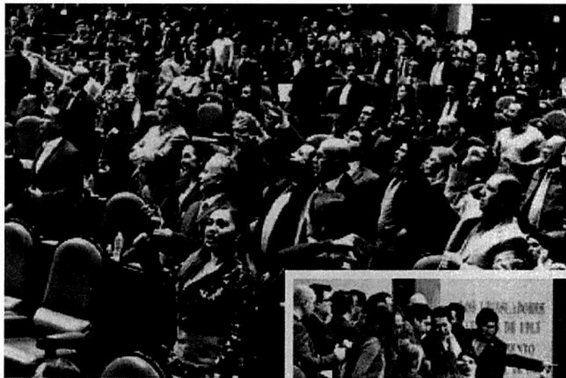
SESIÓN. Tras cerrar la votación, los diputados se presentaron en la tribuna para seguir con la discusión, incluso hubo empujones.

Por ello, consideró que la UIF se presenta como juez y parte, lo que “es a todas luces un contrasentido, pues no existe certidumbre de las decisiones y resoluciones que emita”.