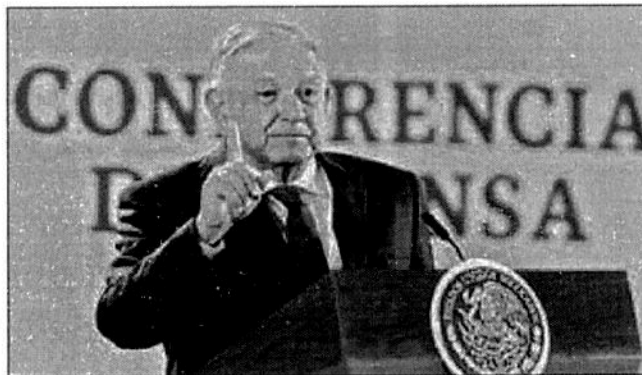
▲ El presidente Andrés Manuel López Obrador durante la conferencia matutina de ayer donde se refirió a los programas sociales como uno de los puntos fuertes de su gobierno.

Por otro lado, en un apretado balance de los puntos positivos de su gobierno, López Obrador destacó los programas sociales, entre los que mencionó el apoyo a los adultos mayores y Jóvenes Construyendo el Futuro, que equiparó con la generación de empleos, así como la estabilidad de las finanzas públicas y la paridad del peso frente al dólar.