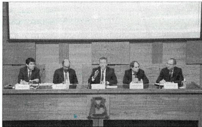
El gobernador del banco central se comprometió a presentar un reporte completo de la génesis del evento, su evolución y conclusiones.

Ciberdelitos deben incluirse en política de administración de riesgos: BM Más información en: eleconomista.mx