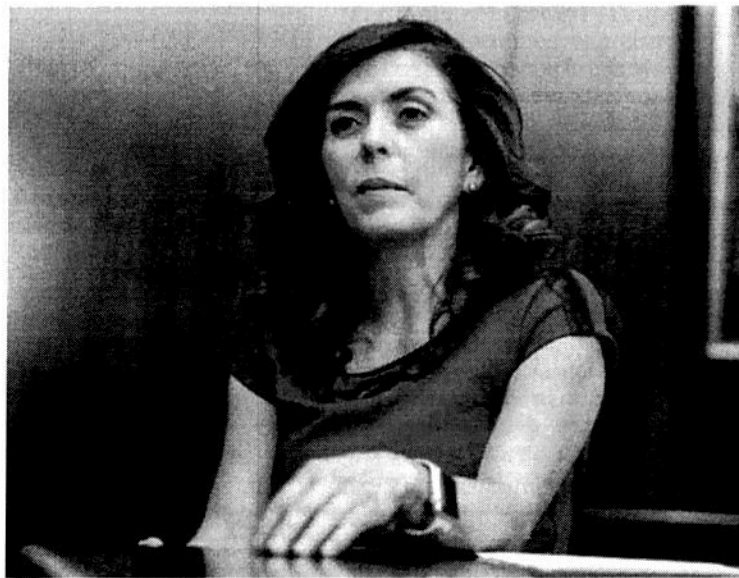
CLAVE. Reyes dice que es importante mantener la confianza de los inversionistas.

“Estamos apostando a que los fondos de capital privado van a seguir invirtiendo”