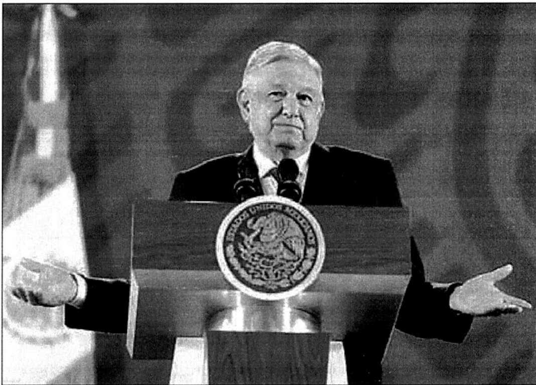
▲ Se pensó que el operativo no iba a tener el grado de dificultad que alcanzó, indicó el Presidente ayer en la conferencia matutina.

Y se hará, reiteró, porque "basta de engaños, de simulación, de maquillaje de cifras".