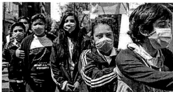
Ciudadanos de la capital del país utilizan cubrebocas como medida de precaución, tras el anuncio de la llegada del coronavirus a México.