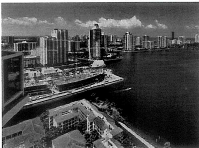
■ Vista de Golden Beach, en Miami, donde Genaro García Luna tenía su casa desde 2013.

Detectan pagos a García Luna en gestión de Videgaray y Mancera