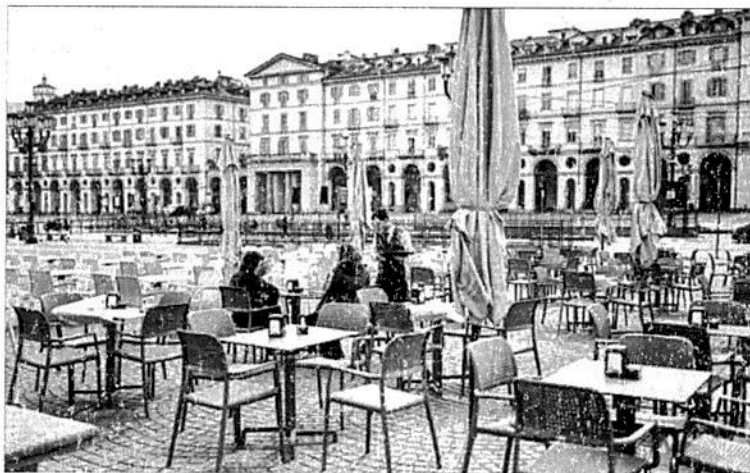
El turismo es una de las actividades que más se ha visto afectada por el brote del coronavirus en Italia, que reporta más de 9 mil contagios. La imagen, en la plaza Vittorio, ayer en Turín.

Canadá reportó el primer deceso; Colombia confirmó tres casos, Costa Rica refirió nueve, Ecuador 15 y Panamá uno.