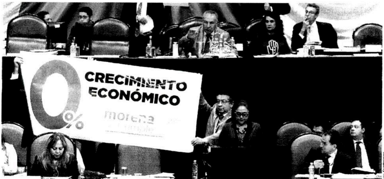
LEGISLADORES, al reprochar al titular de la SHCP (círculo) los resultados en crecimiento económico, ayer.