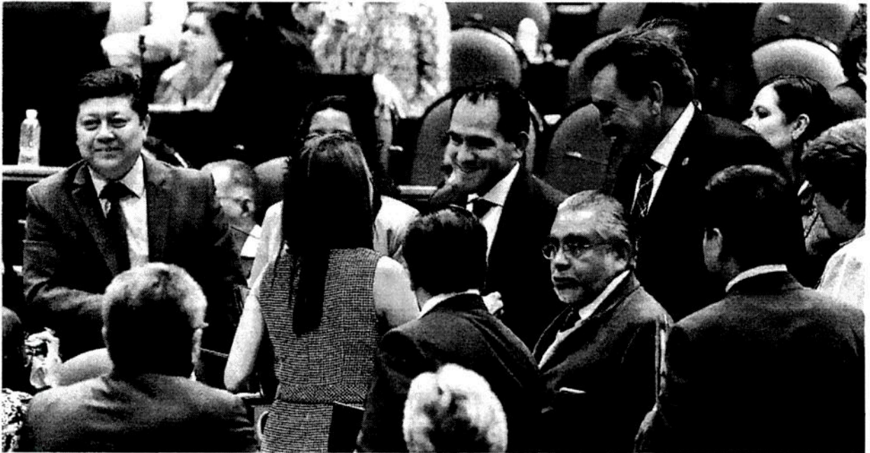
El secretario de Hacienda compareció en la Cámara de Diputados con motivo de la glosa por el primer Informe de gobierno.

El titular de SHCP advierte que el mayor financiamiento deber venir de la IP