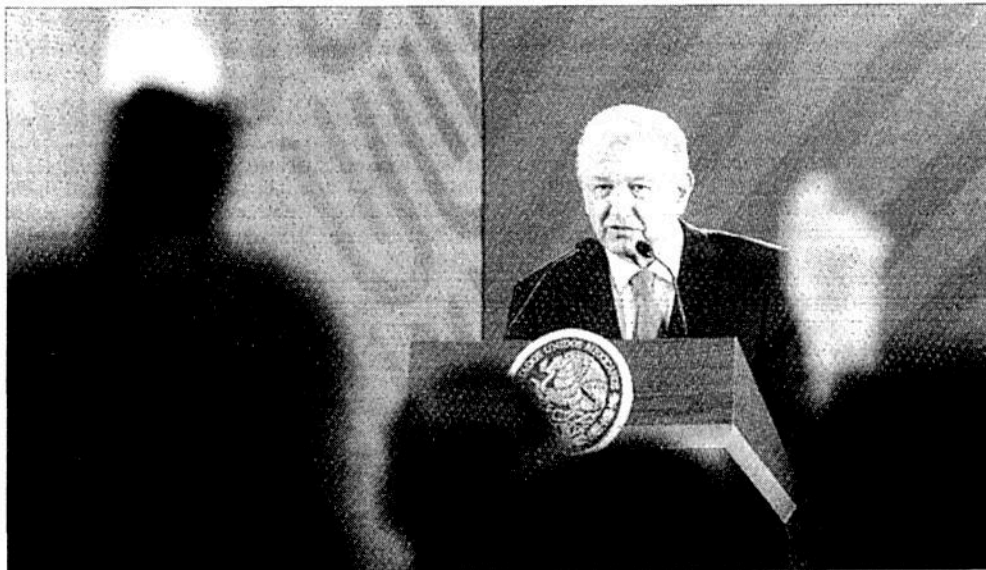
▼ "Es propaganda para afectarnos; ya ven cómo es el hampa del periodismo", respondió López Obrador acerca de los supuestos despidos de médicos y enfermeras.

López Obrador instruyó a Robledo que dé a conocer la próxima semana la lista de hospitales inconclusos, las empresas que no cumplieron y el tipo de contrato de las obras.