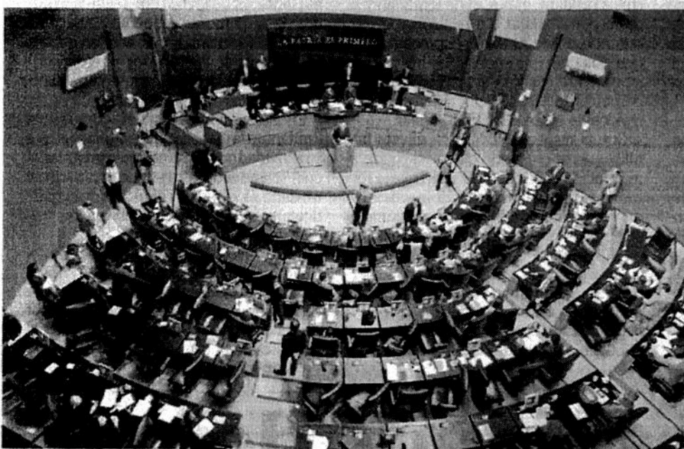
El próximo periodo de sesiones en la Cámara de Senadores iniciará en febrero y terminará en abril. Las reuniones previas de cada una de las bancadas iniciarán la próxima semana.