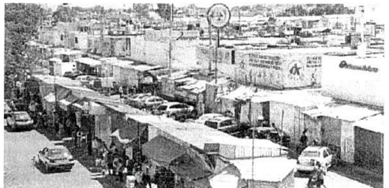
En la capital de Oaxaca, grupos de colombianos que ofrecen préstamos de dinero operan en la Central de Abasto y en colonias aledañas.