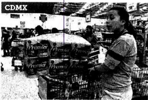
■ En algunos supermercados los clientes hicieron compras de pánico.