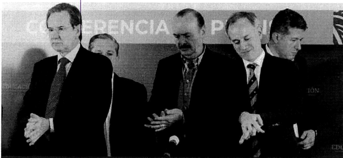
Esteban Moctezuma, titular de la SEP, y Hugo López-Gatell, subsecretario de Salud, se lavan las manos con gel antibacteriano antes del inicio de la conferencia urgente convocada la tarde de ayer en Palacio Nacional.