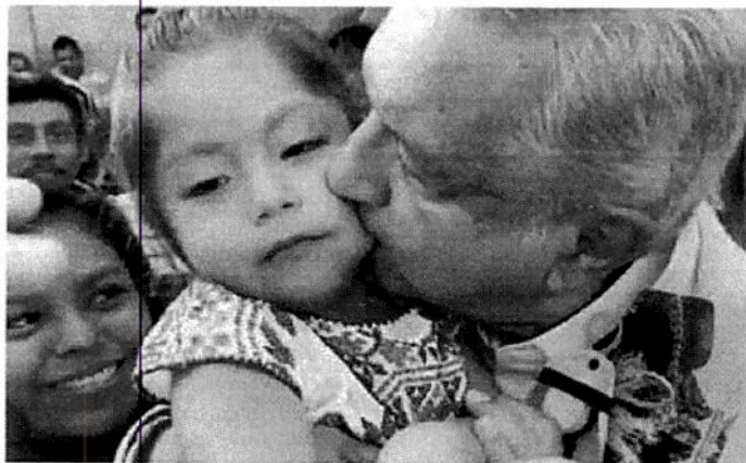
Ante la pandemia de Covid-19, usuarios de redes sociales criticaron que el presidente López Obrador repartiera besos durante su gira por Guerrero.