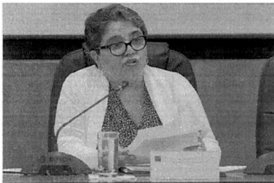
Raquel Buenrostro , jefa del SAT en proceso de ratificación.

Añadió que el órgano recaudador no va por los contribuyentes, mucho menos por los de “clases medias y populares”, ni por los empresarios que, acotó, ayudan a la creación de empleos y contribuyen a las arcas del gobierno.