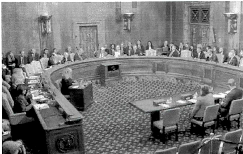
VISTO BUENO. Se espera que el tratado comercial por fin 'vea la luz' este jueves en la Cámara Alta.