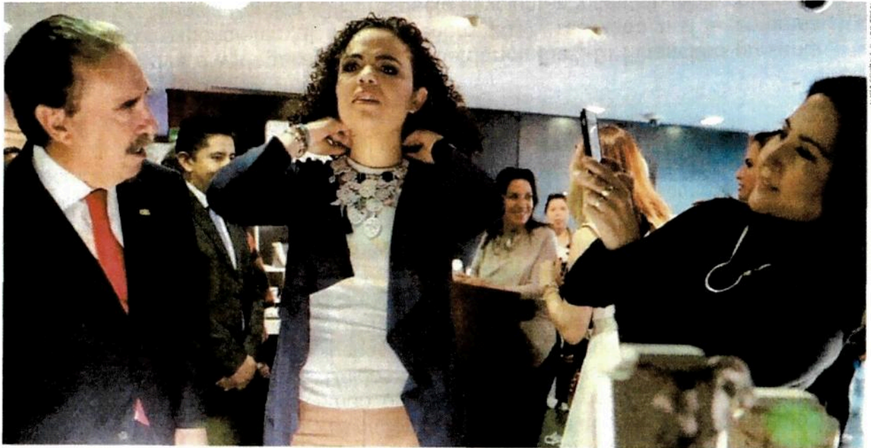
El coordinador del PRI en la Cámara Alta, Emilio Gamboa, dijo que es necesario combatir las noticias falsas. En la foto, con la senadora panista Mariana Gómez del Campo (centro), durante la inauguración de la exposición Hablemos Bien de México, en el Senado.