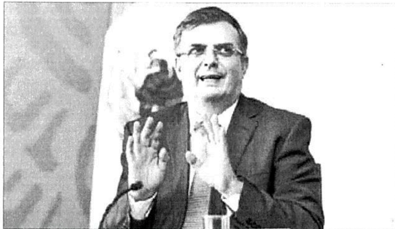
▲ "¡No tenemos nada que ocultar!", aseveró Marcelo Ebrard, secretario de Relaciones Exteriores, al dar a conocer el reporte que la cancillería envió al Senado acerca de las negociaciones con Washington.

Al preguntarle acerca del reforzamiento de la frontera sur, Ebrard señaló que a partir de hoy se desplegarán agentes de la Guardia Nacional hasta este punto y su presencia se reforzará de forma paulatina.