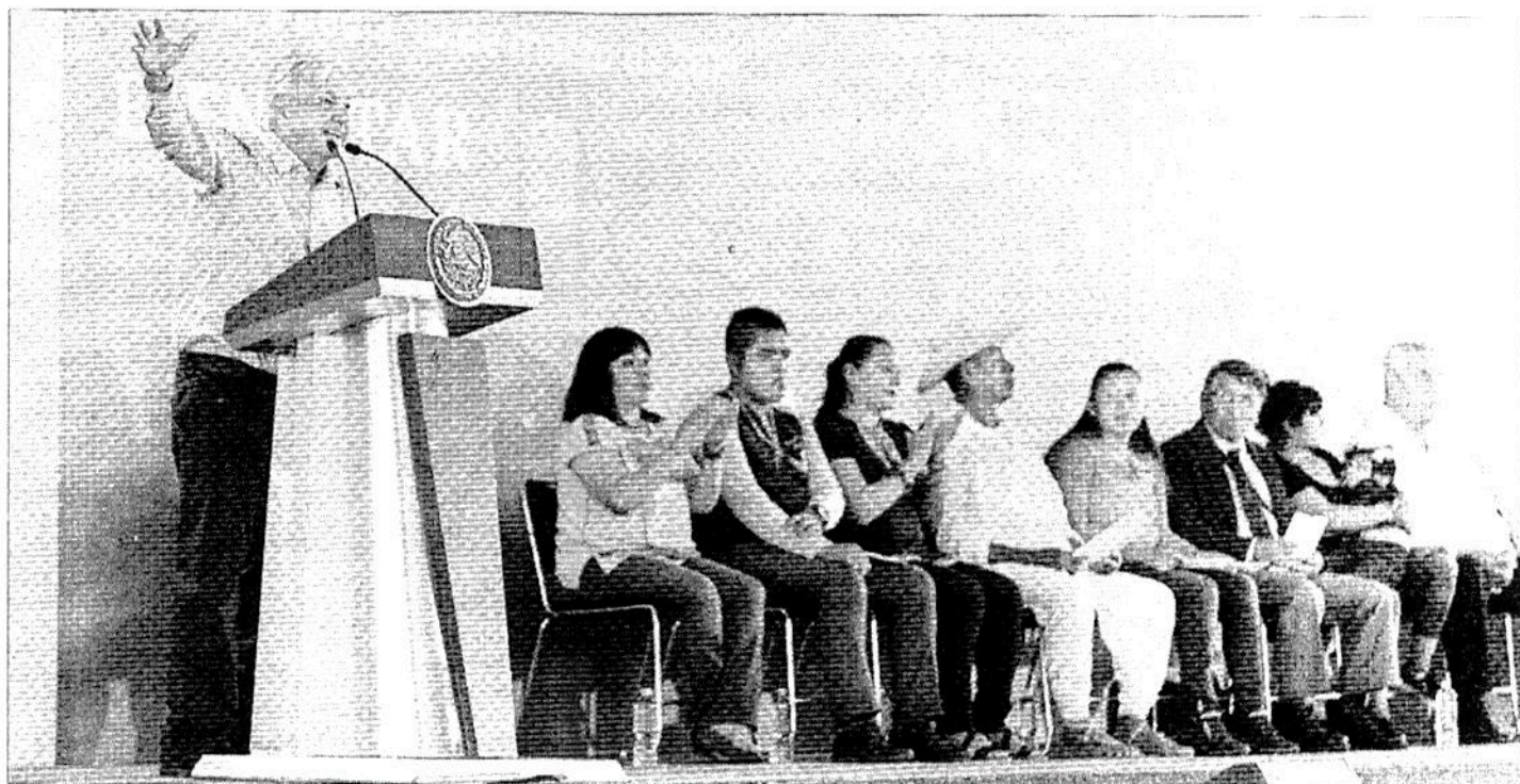
▲ Al visitar Puebla en plena efervescencia electoral, el Presidente Andrés Manuel López Obrador encabezó la presentación de programas de bienestar.