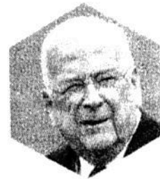
CLAUDIO X. GONZÁLEZ LAPORTE, expresidente del Consejo Mexicano de Negocios

LOS RETOS. Propiciar la estabilidad y la paz laboral para lograr tener las condiciones que se requieren para atraer inversiones, generar empleos y a través de ello crecer a mayores tasas. Estos elementos pueden incluirse en la reforma laboral que se estará discutiendo en las siguientes semanas, a fin de que tenga impacto positivo para empresarios y trabajadores y se logre mayor desarrollo nacional.