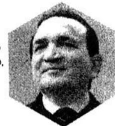
JOSÉ MANUEL LÓPEZ CAMPOS, presidente de la Concanaco Servytur.

LOS RETOS. Mantener la participación entre sector público y privado es la única forma de alcanzar los niveles de crecimiento de 4% anual que se han prometido, de ahí que sea fundamental un entorno de gobernanza y absoluta confianza. Además, las medidas que se han tomado hasta ahora se pueden rectificar para ser la punta de lanza de un crecimiento más ordenado en el largo plazo.