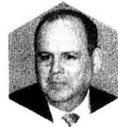
GUSTAVO DE HOYOS WALTHER, presidente de la Coparmex

LOS RETOS. Garantizar la aplicación del Estado de derecho, pues tolerar las violaciones a la ley como se hizo cuando se obstruyeron las vías ferroviarias de Michoacán aleja los proyectos productivos nacionales y extranjeros, además es indispensable que se tomen medidas para preservar el equilibrio macroeconómico, pues los anuncios cotidianos de programas sociales podrían ponerse en riesgo.