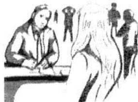
Ilustraciones: Daniel Rey