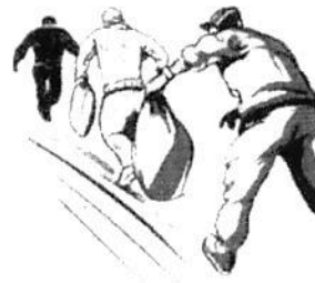
Ilustración: Daniel Rey

Sólo había un guardia de seguridad privada, el cual fue desarmado, y el resto de empleados, sometido.