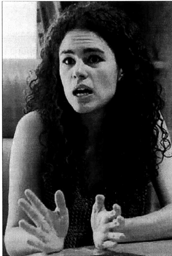
Luisa María Alcalde, secretaria del Trabajo.

aprendiz como el tutor, reportan el avance en las metas establecidas en la capacitación”.