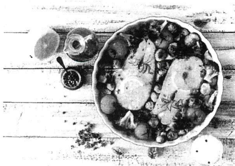
Nafin adquirió desde cerveza, agua mineral Perrier, bacalao, blueberries, chistorra, Clamato y jamón serrano hasta machaca y salmón chileno fresco.

MILLÓN 670 mil 100 pesos cubrió la Conaliteg por concepto de servicios de comedor par las plantas de Querétaro y Tequesquínahuac.