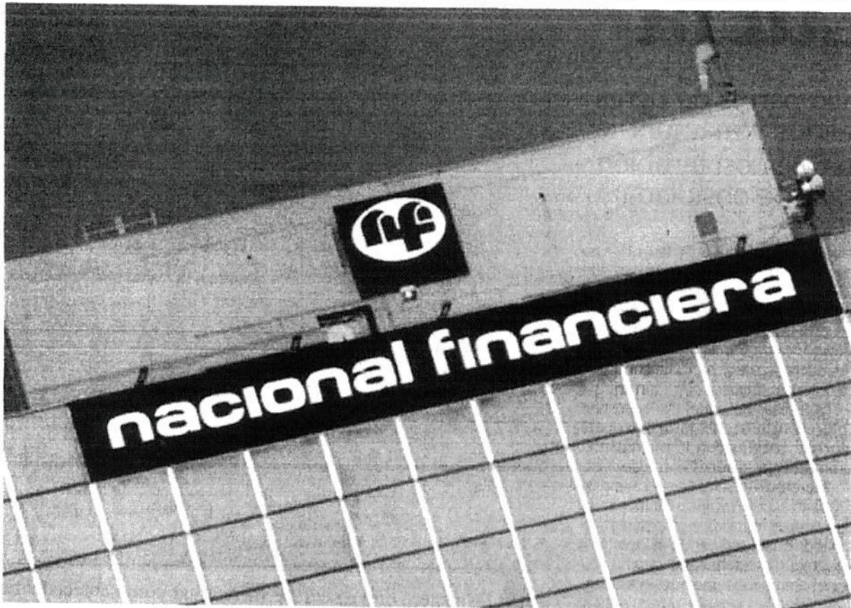
Nacional Financiera también encargó la adquisición de 350 six pack de cerveza de diferentes marcas y pagó hasta 140.63 pesos por empaque, es decir, 38.13% más que su costo al público en tiendas y supermercados.