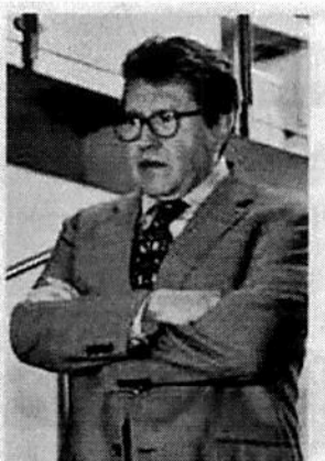
■ Ricardo Monreal anunció la subasta de 170 vehículos.

Adicionalmente, el zacatecano adelantó que en los próximos días subastarán 170 vehículos que estaban a disposición de funcionarios y legisladores a fin de disminuir gastos en gasolina, mantenimiento y seguros.