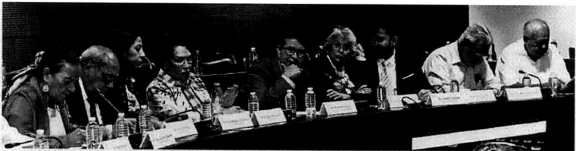
El grupo parlamentario de Morena en el Senado acordó impulsar la desaparición de 22 comisiones legislativas ordinarias.