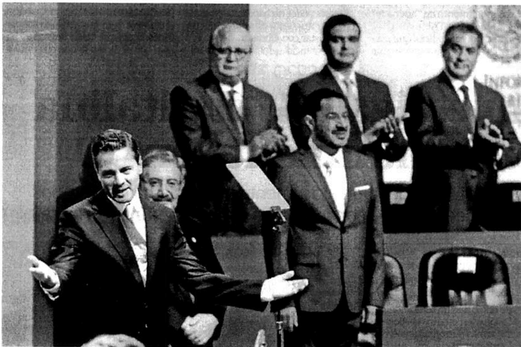
El presidente Enrique Peña Nieto rindió su 6to Informe de Gobierno. Atrás se encuentran los presidentes de la Corte, Luis María Aguilar, y del Senado, Martí Batres, y los gobernadores Graco Ramírez, Antonio Echevarría y Jaime Rodríguez.