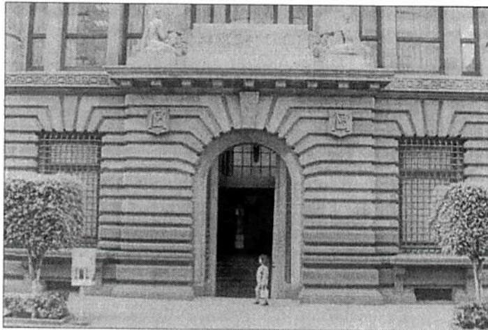
El Banco Central recortó en la víspera sus expectativas de crecimiento para este año.