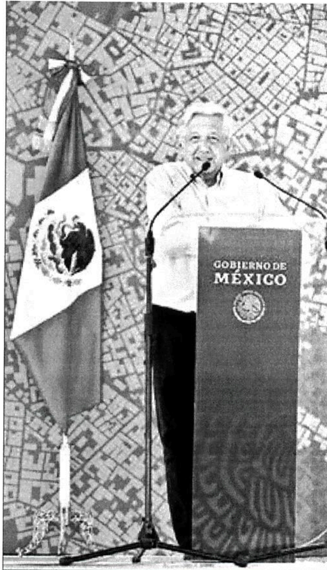
► En Cabo San Lucas, el presidente Andrés Manuel López Obrador provocó aplausos de pie y gritos al anunciar que no se permitirá la mina de oro a cielo abierto de Los Cardones, por sus eventuales daños al medio ambiente. “Al paraíso hay que cuidarlo, no destruirlo”, afirmó.

Subrayó que habrá prioridad para regularizar la situación jurídica de viviendas, con la entrega de escrituras, además de que éstas se mejorarán, al igual que los barrios.