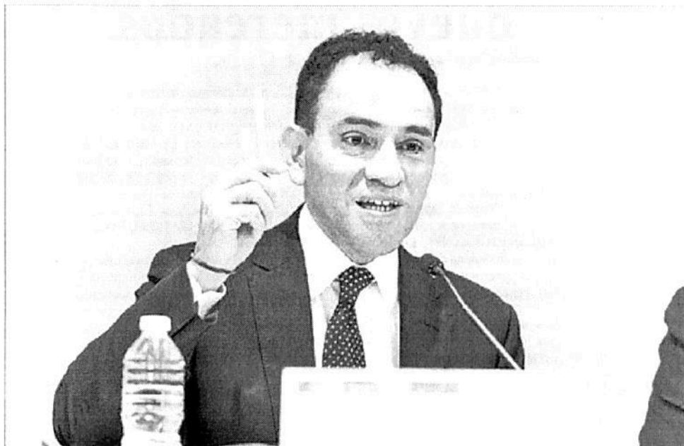
▲ El secretario de Hacienda, Arturo Herrera Gutiérrez, presentó el informe trimestral sobre la situación económica.

*Variación Porcentual Estimación oportuna. Cifras Desestacionalizadas. Fuente: Inegi