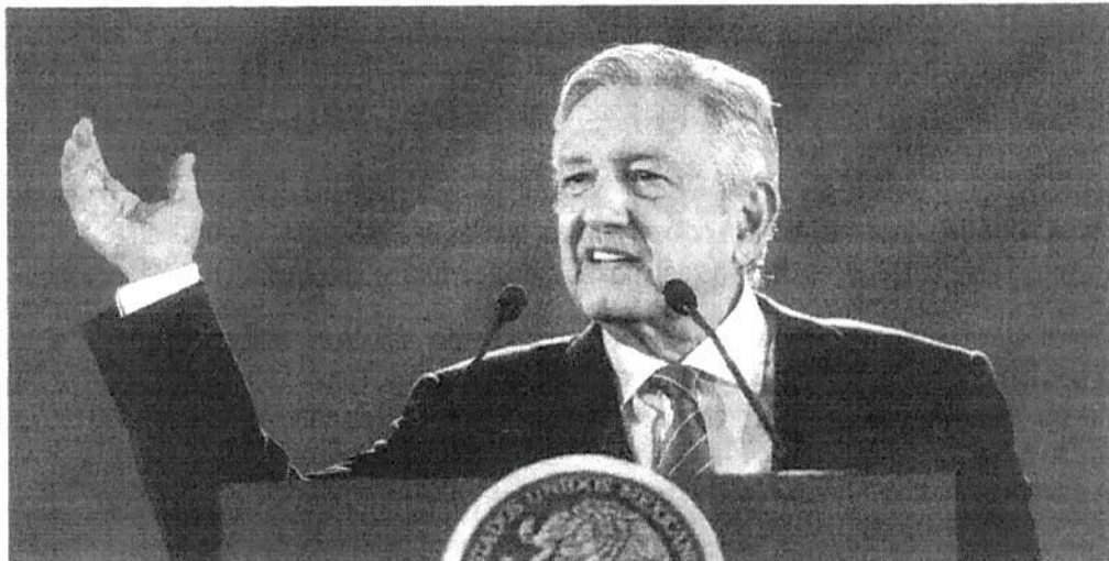
El Presidente criticó que en sexenios anteriores, los mandatarios ordenaban y hasta hacían acuerdos para las detenciones o frenar investigaciones.

ANDRÉS MANUEL LÓPEZ OBRADOR Presidente de México