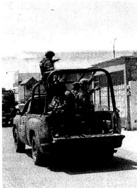
Guanajuato y Baja California son los estados más violentos en la actual gestión federal.

Manuel Espino / Misael Zavala / Alberto Morales