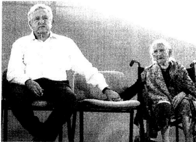
López Obrador entregó ayer en Guadalajara apoyos a adultos mayores, personas con discapacidad, estudiantes y jóvenes aprendices.