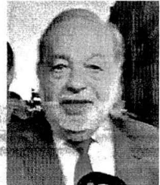
■ Carlos Slim Helú.