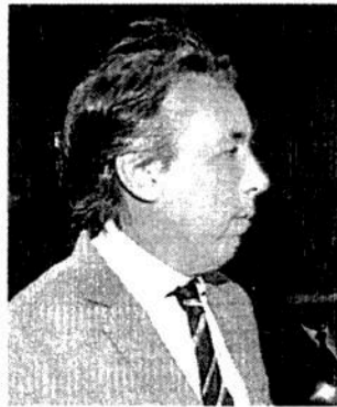
■ Emilio Azcárraga Jean.