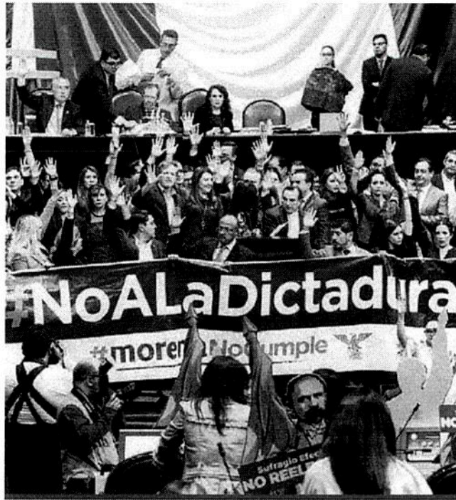
Legisladores de oposición protestaron contra la decisión de Morena de imponerse en la sucesión de la Mesa Directiva de la Cámara baja.

Recordó que en el Senado sí se han logrado acuerdos y puentes de comunicación entre el bloque opositor y también con el bloque de la mayoría y confió en que se sigan cumpliendo los acuerdos.