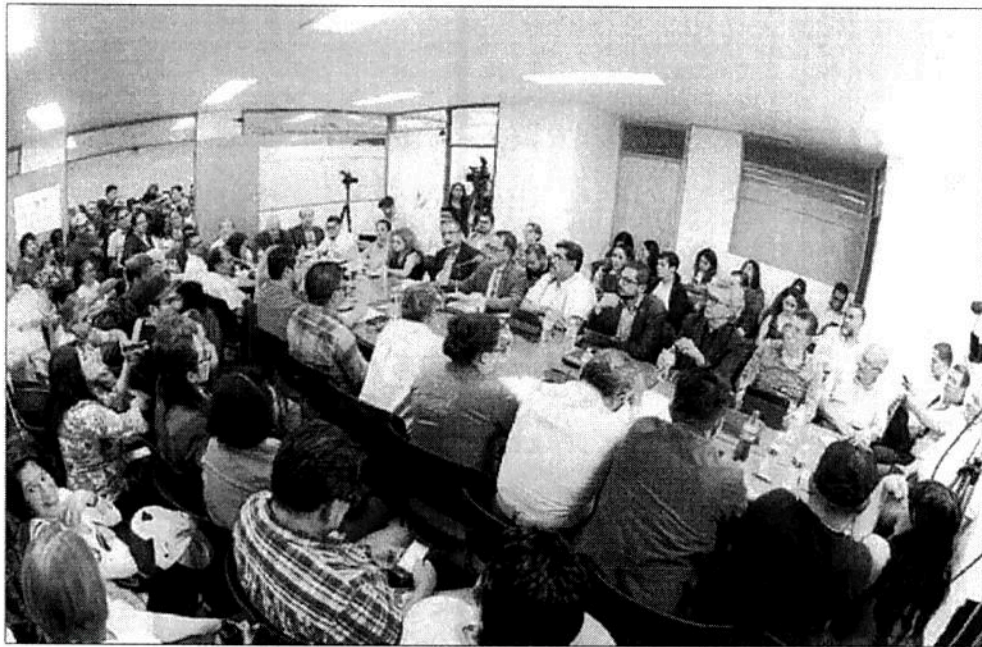
La mesa de negociación entre el Sindicato y la administración de la UAM, se realizó en la sede de la Secretaría del Trabajo y Previsión Social (STPS).