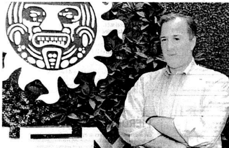
El candidato abordó la situación de los huachicoleros y del narcotráfico

López Obrador y Ricardo Anaya Cortés, aprovecharon los vacíos de la ley electoral para promocionarse desde sus cargos como dirigentes nacionales de Morena y Acción Nacional.